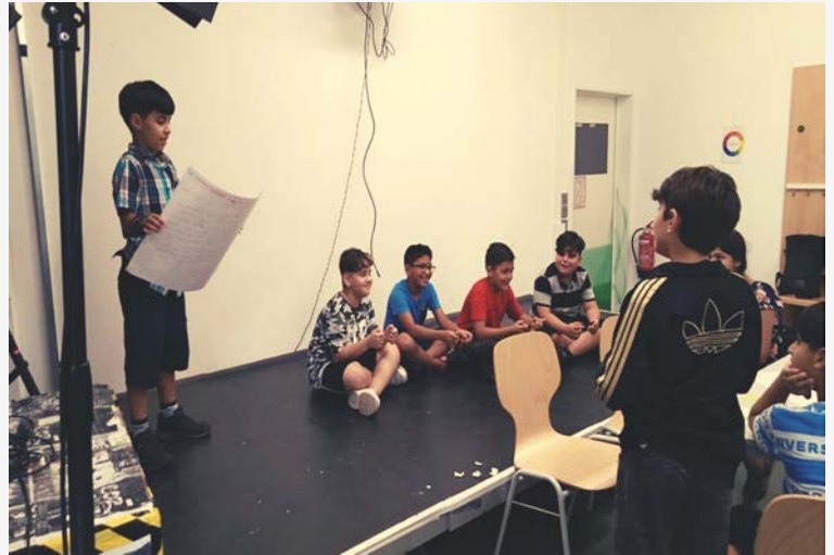
DREHBUCH SCHREIBEN IN TEAM FÜR DEN FILM „VERSPIELTES GAMEPAD“