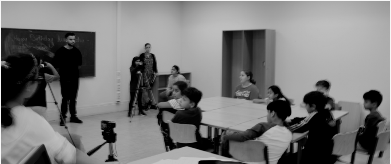
HINTER DER AUFNAHMESET, WORKSHOP 1