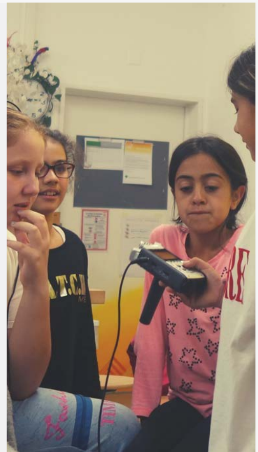
TONAUFNAHME FÜR DEN FILM „MAGISCHE WOLLE“